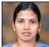
നിമ ലിന്റോ മാൻഡ്യാ രൂപത