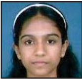
അന്നു മാത്യുസ് പാലാ രൂപത