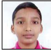
ജോർജ്ജ് ജുഡിറ്റ് തലശ്ശേരി രൂപത