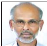
മാത്യു തൈക്കുന്നുംപുറത്ത് താമരശ്ശേരി രൂപത