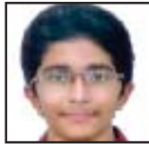
ഡോൺ സാബു പാലാ രൂപത